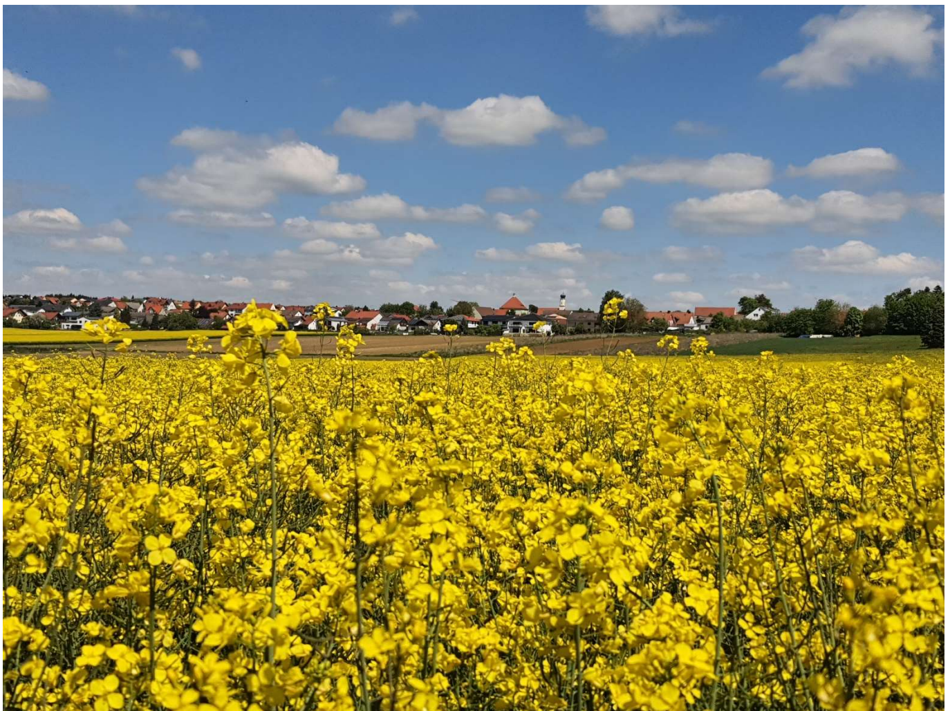
Blick auf Westerhofen zur Zeit der Rapsblüte